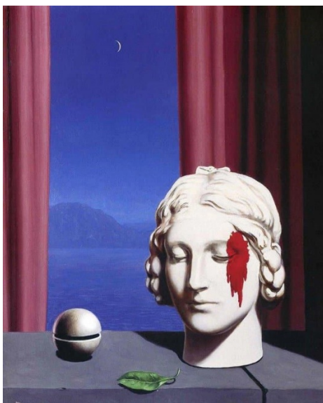
René Magritte, Geheugen , 1942